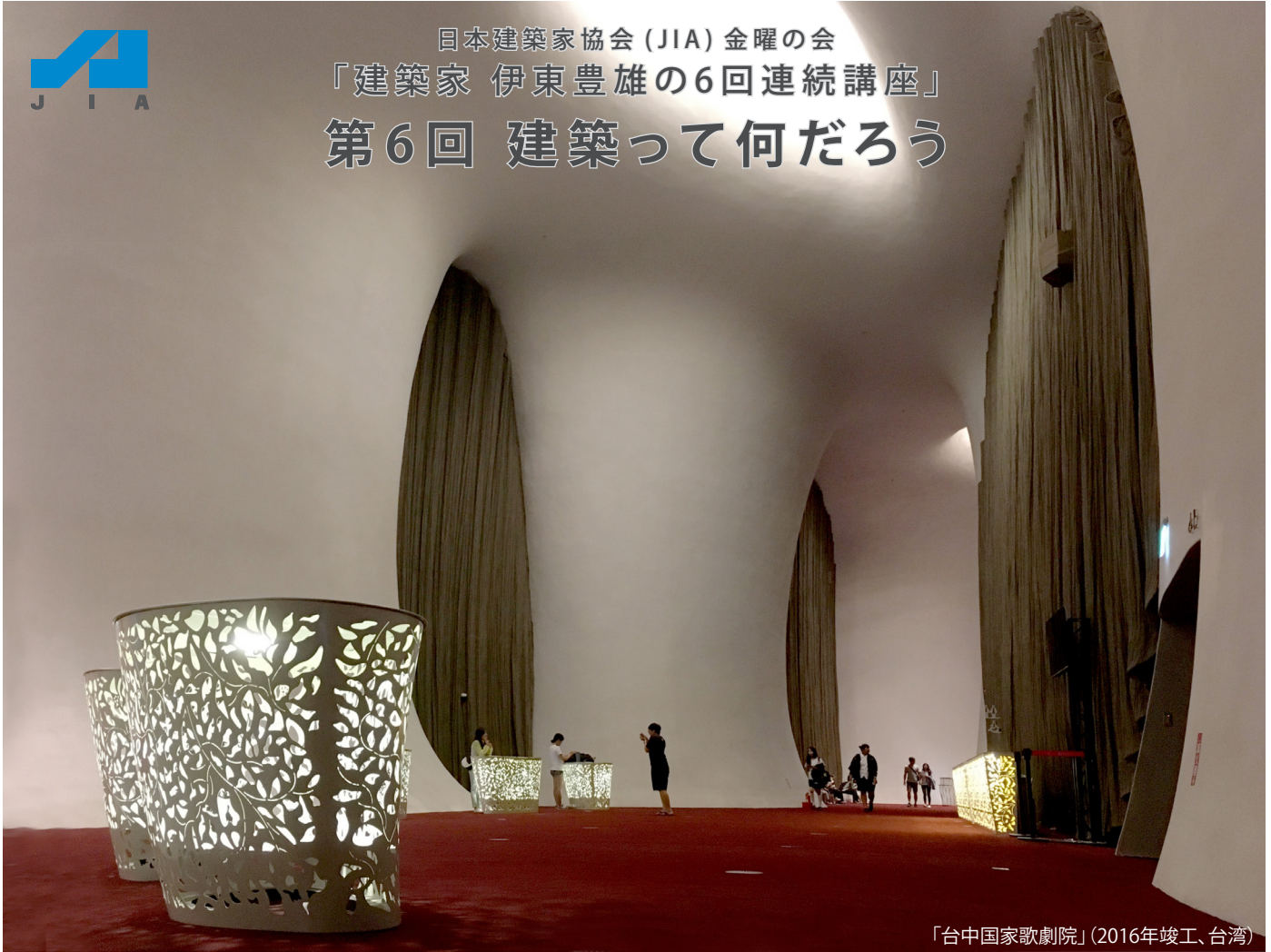
「台中国家歌劇院」(2016年竣工、台湾)